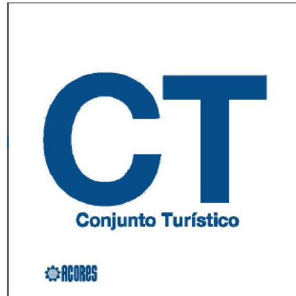
Sinal nº 6