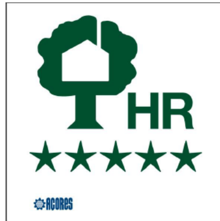
Sinal nº 10