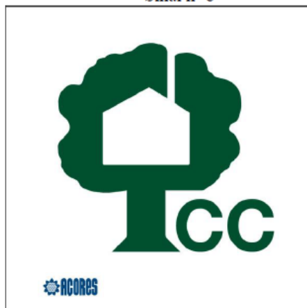
Sinal nº 8