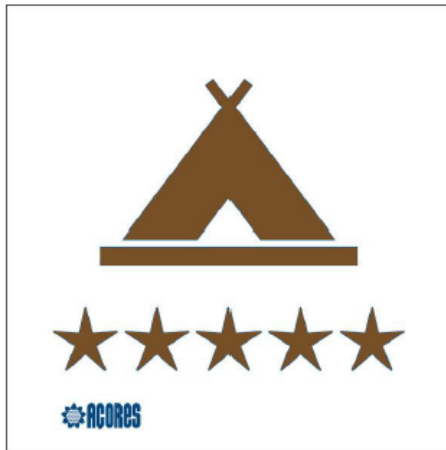
Sinal n° 13