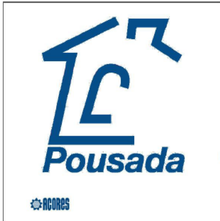
Sinal nº 3