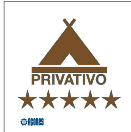
Sinal n° 15